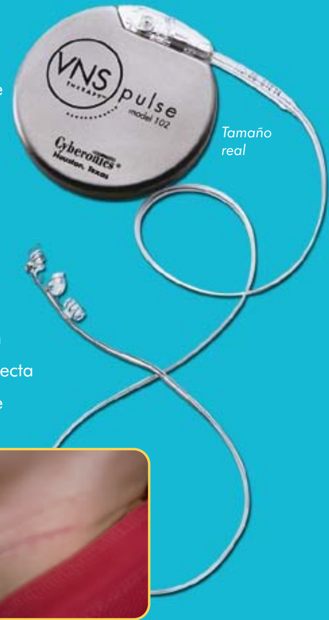
3 meses después del procedimiento